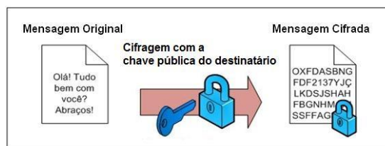
Figura 4: Criptografia assimétrica: No remetente, cifragem com a chave pública do destinatário.

As figuras 4 e 5 ilustram respectivamente o esquema da cifragem e decifragem com chaves assimétricas.