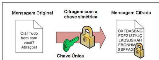
Figura 2: Criptografia simétrica: cifragem