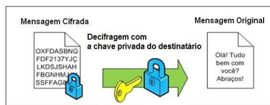
Figura 5: Criptografia assimétrica: No destinatário, decifragem com a chave privada.