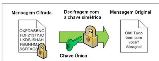
Figura 3: Criptografia simétrica: decifragem